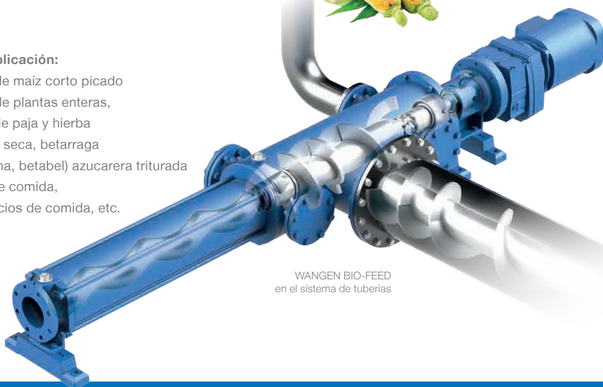
WANGEN BIO-FEED en el sistema de tuberías