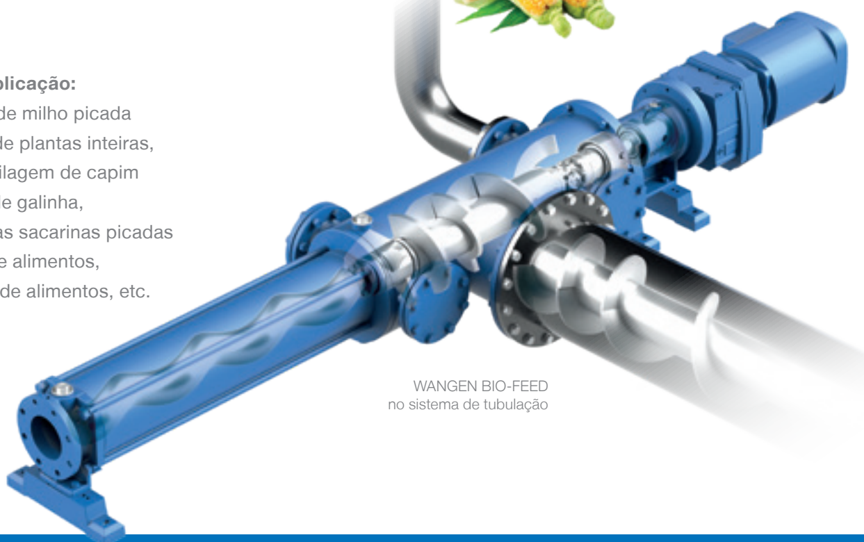
WANGEN BIO-FEED no sistema de tubulação